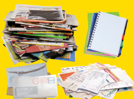
journaux, magazines, publicités, enveloppes, courriers, cahiers...*