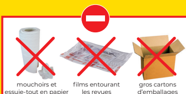
mouchoirs et essuie-tout en papier