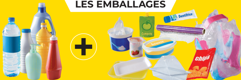
bouteilles et flacons en plastique